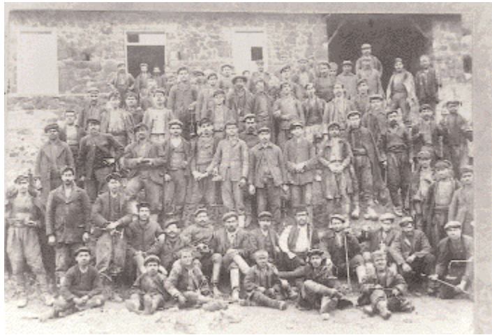
Μαδέμ Λάκκος: Μεταλλωρύχοι έξω από τη στοά. Δεκαετία 1920 (Αρχείο Ι. Κουιμτζή) ΑΕΕΧΠ&Λ

Στα 600 περίπου καμίνια της περιοχής απασχολείται μια πολυεθνική κοινότητα 6.000 εργατών, σε μία πρώιμη εκδοχή πενθημέρου, καθώς οι Εβραίοι εργάτες είχαν αργία το Σάββατο ενώ οι Χριστιανοί την Κυριακή. Έως το 1900 εξορύσσονται και περνούν από μεταλλουργική κατεργασία στα καμίνια της εταιρείας 72.000 τόνοι μεταλλεύματος. Το 1901 η εταιρεία αρχίζει την επιφανειακή εκμετάλλευση του κοιτάσματος σιδηροπυρίτη στο μεταλλείο του «Μαντέμ Λάκκου» κοντά στη Στρατονίκη.